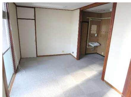
ワンフロア洋室(12帖)。