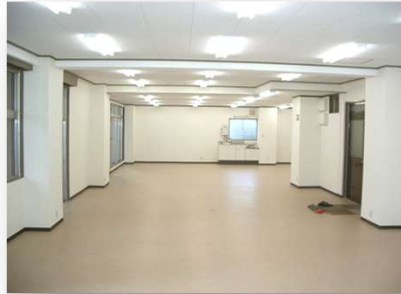
ワンフロア(52坪)。エアコン付。